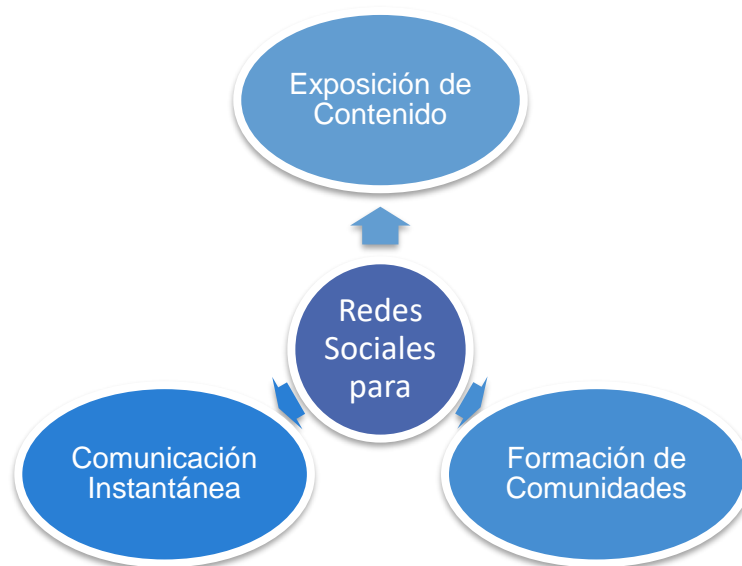
Figura 1. Tipos de redes sociales

Las redes sociales se pueden dividir en tres grupos relevantes que poseen funciones diferentes: