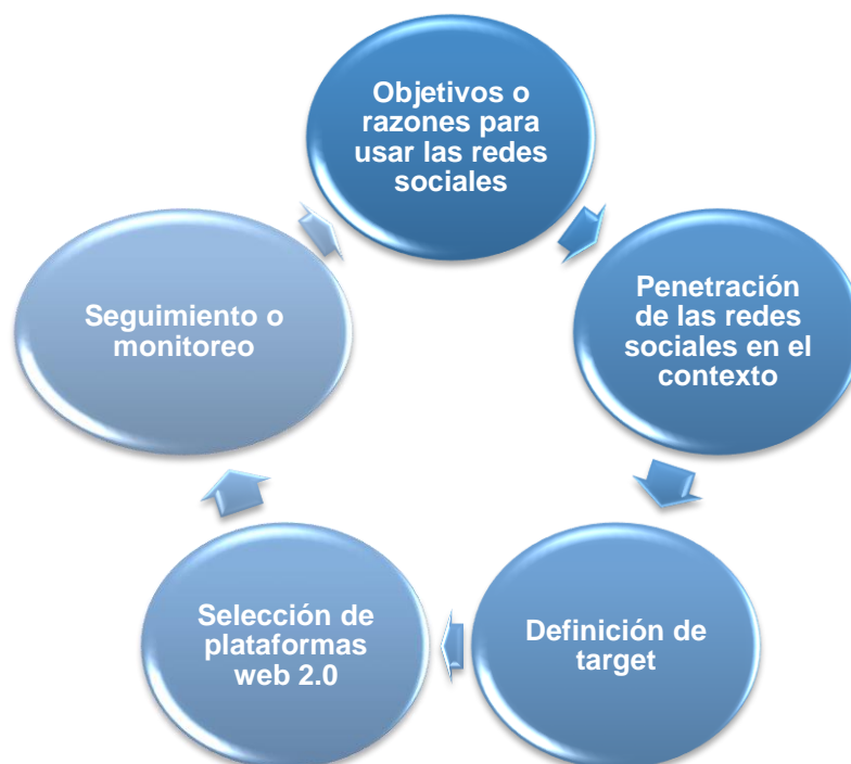
Figura 4. Ciclo de la estrategia en redes sociales

La primera etapa es la definición de los objetivos o razones para usar las redes sociales en función de su valor instrumental para alcanzar algún tipo de logro para la institución.