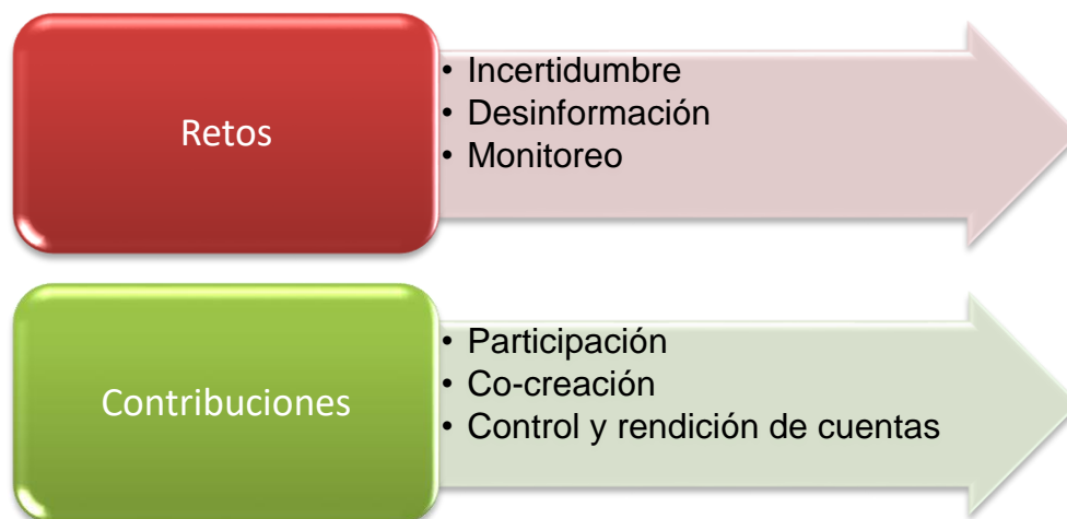
Figura 2. Retos y contribuciones de las redes sociales

Ahora bien, se deben tener presentes los retos y las contribuciones que estas poseen: